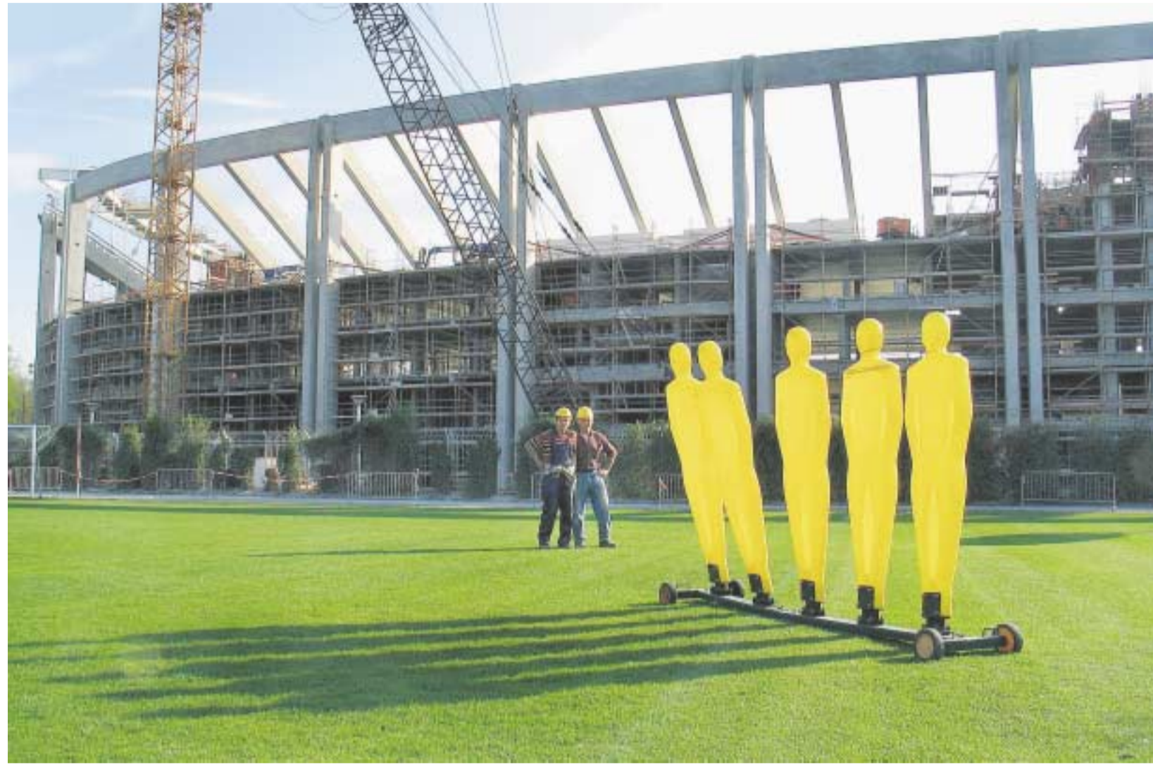
Mauertaktik: Beim Bau des neuen Waldstadions häufen sich die Nachträge des Generalübernehmers Max Bögl. Inzwischen sollen die Kosten rund 30 Millionen Euro über der ursprünglich veranschlagten Summe liegen. Doch offiziell will man im Magistrat von der Kostenexplosion nichts wissen. Diese war wegen der mangelhaften Ausschreibung absehbar. Wäre sie mit mehr Sorgfalt erfolgt, hätten die Kosten zwar etwas höher gelegen, wären jedoch einzuhaltend gewesen. Das Nachsehen hat jetzt die Stadt und damit der Steuerzahler.

Die skandalösen Vorgänge um den Stadionbau müßten von der Stadtverordnetenversammlung aufgearbeitet werden. Daß sich der in unheiliger Solidarität miteinander verbundene Vierer im Römer dazu aufrafft, ist jedoch unwahrscheinlich. MATTHIAS ALEXANDER